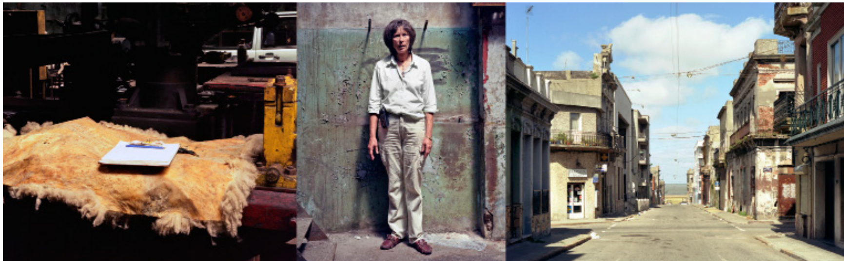
Sans titre (de la série Montevideo ), 1998-2002, C Print, 48 X 155 cm.