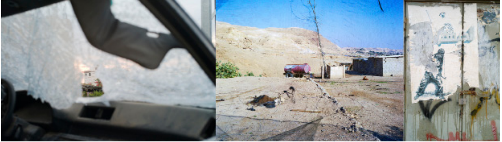
Sans titre (de la série Aqbat Jabber, Palestine ), 2009, C Print, 48 X 159 cm.