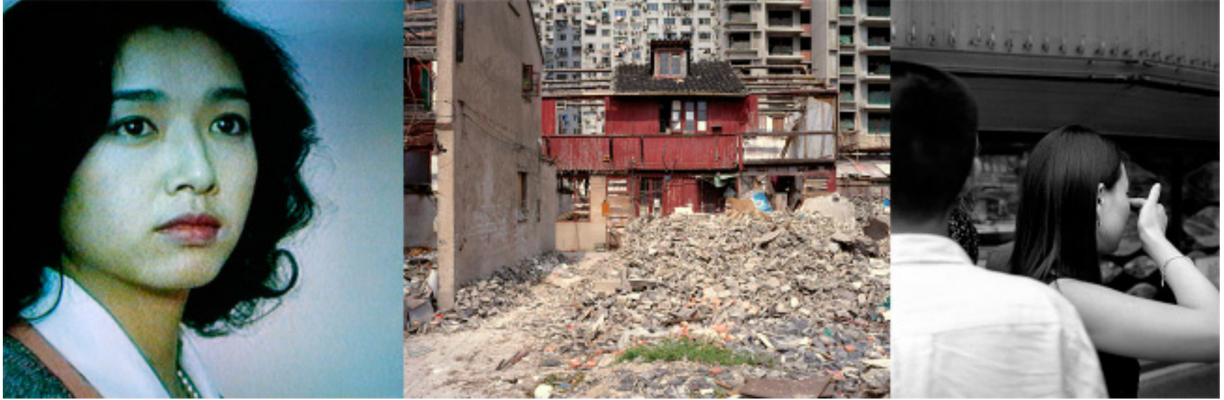
Sans titre (de la série Shanghai Triptyques ), 2005, C Print, baryté au gélatino bromure d'argent , 48 X 146 cm.