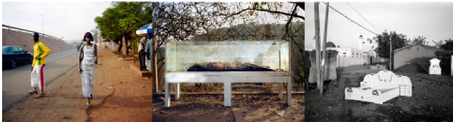
Sans titre (de la série Bamako ), 2007, C Print, 48 X 178 cm.