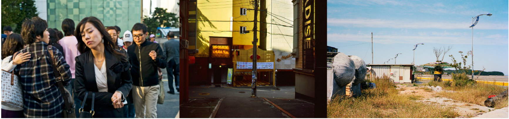
Sans titre (de la série Séoul Compact ), 2009, C Print, 48 X 205 cm.