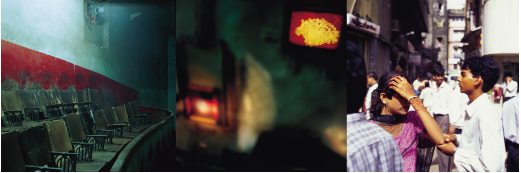
Sans titre (de la série Bombay, sans effraction qu'intime ), 2000, Cibachrome , 100 X 300 cm.